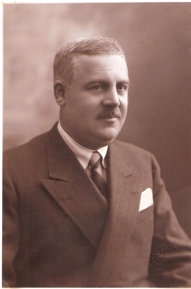
Theodor P. Frangopol logodit 24 ianuarie 1932 nascut la Constanta in 1887- decedat la Constanta in 1955

culoarea apei schimbându-se din verzuie datorită algelor ce le aduceau la mal, cenușie sau albă mai către mal unde spuma valurilor crea o ireală pătură apei mării ce se domolea când atingea nisipul plajei. Panorama naturii dezlănțuite este unică și mai târziu, când revenind la Constanța în concediu, contemplarea mării mă determina să strig, și eu în sinea mea, bucuria și fericirea de a o revedea, thalassa, thalassa (marea, marea) precum au exclamat cei zece mii de soldați ai lui Xenofon care după o retragere de 16 luni au zărit marea.