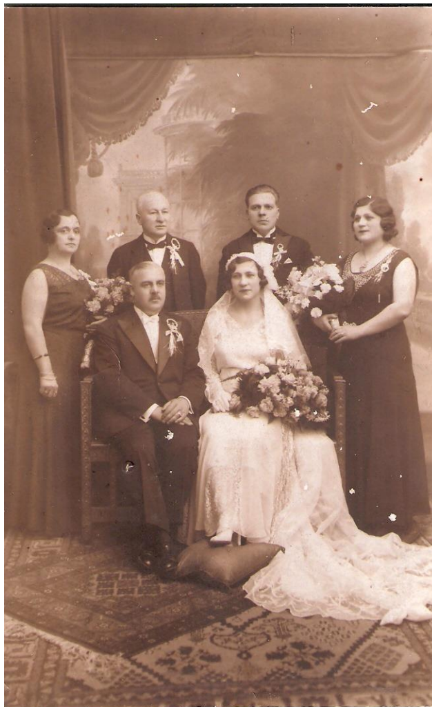
Poza de la casatorie 1932